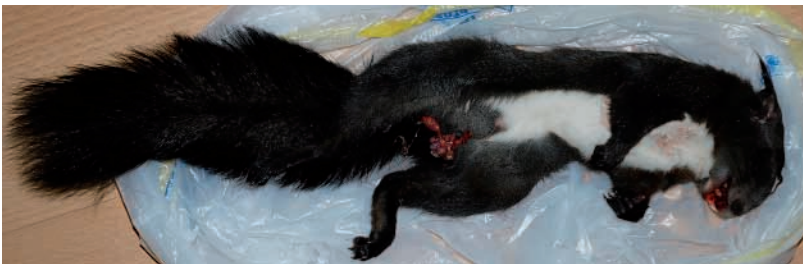
Eichhörnchen mit schwarzer Fellfärbung.