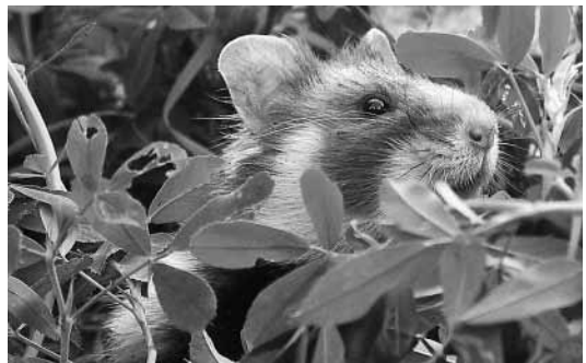
Junger Feldhamster bei seiner Auswilderung in Mannheim-Straßenbeim; das Tier hat kurz zuvor den im Hintergrund sichtbaren Transportkäfig verlassen (Ausschnitt aus Abb. 1).