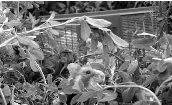
Abb. 1: Junger, gezüchteter Feldhamster, der gerade in Mannheim-Straßenheim ausgewildert wird.

Für den Feldhamster bedeutete die Umsetzung der Baumaßnahmen dennoch den weiteren Verlust von angestammtem Lebensraum. Als durch den heißen Sommer 2003 zudem einzelne Mannheimer Feldhamsterpopulationen zusammenbrachen oder ganz verschwanden, wurde ein Wiederansiedlungsprogramm im Rahmen des Artenhilfsprogramms ins Leben gerufen. Im Institut für Faunistik, das mit dem Heidelberger Zoo zusammenarbeitet, begann deshalb die Nachzucht von Feldhamstern. Die Stadt wies das Landschaftsschutzgebiet Straßenheimer Hof in günstiger Lage in Mannheim-Straßenheim aus und nahm dort 3 ha Aussiedlungsfläche unter Vertrag. Im Jahr 2007 schließlich wurden die ersten Feldhamster der Heidelberger Nachzucht ausgesetzt. Nach unliebsamen Erfahrungen mit Füchsen im Auswilderungsgebiet, vor deren Bauen ein beträchtlicher Teil der Telemetriesender gefunden wurde, die den jungen Feldhamstern angelegt worden waren, stellt sich langsam erster Erfolg ein.