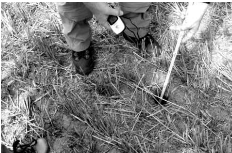
Abb. 2: Während der Kartierung 2009 des NABU Mannheim im „Häusemer Feld“ gefundener Feldhamsterbau (Foto: Christine Schröter).

Neben den Wiederansiedlungsregionen gibt es in Mannheim noch Flächen, auf denen wildlebende Feldhamster vorkommen. Dies gilt vor allem für das Mühlfeld und das Wörthfeld an der Gemarkungsgrenze zu Edingen-Neckarhausen. Im Mühlfeld konnte zuletzt von ca. einem Dutzend Tieren ausgegangen werden. Im Mannheimer Häusemer Feld und im Wörthfeld, und damit in einem Gebiet des Rhein-Neckar Kreises, wurden bei Kartierungen des NABU Mannheim in Zusammenarbeit mit Dr. Ulrich Weinhold im Sommer 2008 und 2009 jeweils ein Hamsterbau an unterschiedlichen Standorten gefunden.