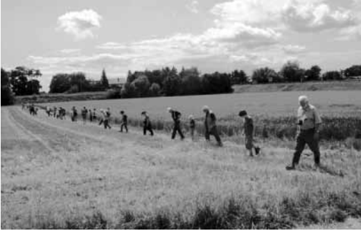
Abb. 4: Freunde und Mitglieder des NABU Mannheim am Tag der Artenvielfalt 2009 bei der Feldhamsterkartierung im „Häusemer Feld“ (Foto Christine Schröter).