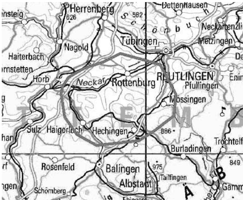
Abb. 1: Übersichtskarte des kartierten Gebietes.

Ein Schwerpunkt dabei war die Sieben-Täler-Höhle im Katzenbachtal zwischen Bad Nieder-nau und Kiebingen, in der neben der Artbestimmung von Fledermäusen auch noch die kli-matischen Daten der Höhle erfasst wurden. Hier sollte untersucht werden, ob ein Zu-