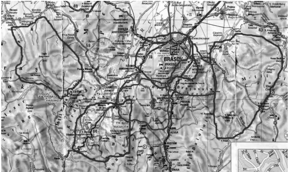
Territorien von 6 Wolfsrudeln in der Nähe von Brasov (Kronstadt) in den Südkarpaten.

8 Wolfsrudel telemetriert, 6 davon teilweise sehr intensiv. Auf der Karte habe ich die Territorien dieser Rudel mit kräftigen Linien umgrenzt. 24 verschiedene Wölfe aus diesen 6 Rudeln konnte ich beobachten. Insgesamt hatten diese 6 Rudel mindestens 28 Tiere. Das waren aber nicht alle Wölfe bzw. Rudel, die sich in unserem Forschungsgebiet aufgehalten haben.