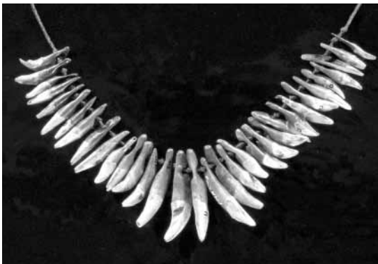
Durchbohrte Raubtiereckzähne aus der Siedlung im „Dullenried“ am südlichen Federseeufer: Die Halskette bietet einen interessanten Einblick in oberschwäbisches Schmuckdesign gegen Ende der Jungsteinzeit.

Im Rahmen seiner Ausstellungsfolge „Den frühen Mensch-Tier-Beziehungen auf der Spur“ präsentiert das Federseemuseum in Bad Buchau vom 21. Mai bis 1. November 2006 eine Sonderausstellung, die den „Pelztieren“ gewidmet ist.