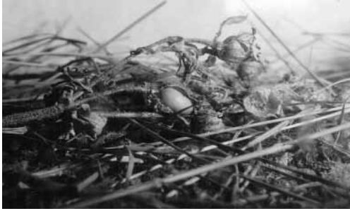
Abb. 2: Von Waldspitzmäusen angefressene Samenkapseln des Taubenkropf-Leimkrauts ( Silene vulgaris ); Niederösterreich 1974