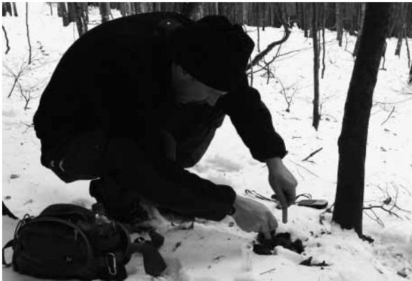
Beim Einsammeln von frischer Bärenlosung.

Derzeit bemühe ich mich darum, ein Monitoringprogramm zu entwickeln. Zunächst sollen Migrationsbewegungen innerhalb der Karpaten festgestellt werden, um langfristig auch einen Indikator dafür zu haben, wie sich der Ausbau der Infrastruktur in den Karpaten auf das ökologische Netzwerk auswirkt. Im zweiten Schritt möchte ich dieses Monitoringnetzwerk zusammen mit lokalen oder nationalen Partnern auch in den angrenzenden Ländern entwickeln, und zwar bis nach Deutschland. Neben den klassischen Untersuchungstechniken möchte ich auch die Genetik einbeziehen. Labortechnisch ist das zwar nicht einfach, aber es ist mittlerweile einfacher geworden, genetische Untersuchungen selbst an Kotproben durchzuführen.