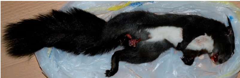
Eichhörnchen mit schwarzer Fellfärbung.